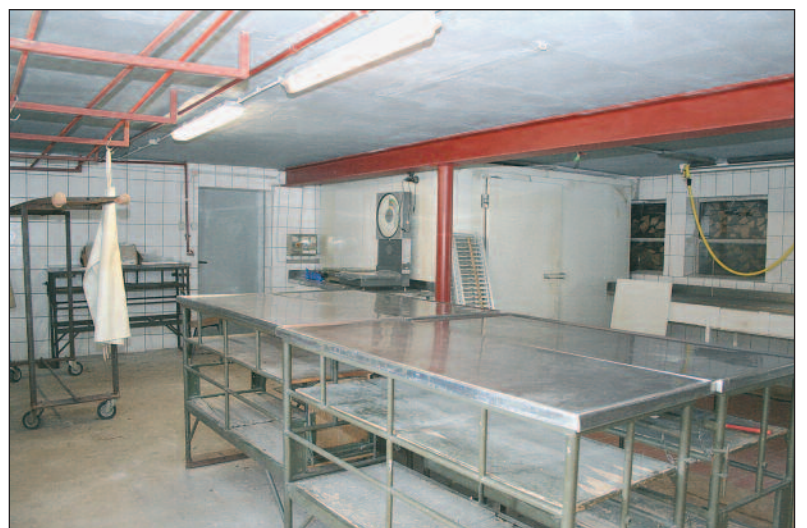
Im hofeigenen Schlachthaus geht es drei Mal im Jahr richtig rund.