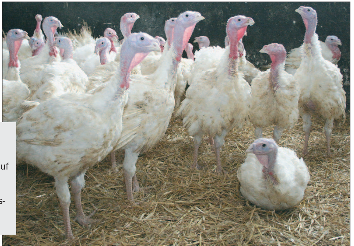
Auf der mit Stroh von bester Qualität eingestreuten Liegefläche genießen die Puten auf Hof Königstein viel Komfort und Behaglichkeit.